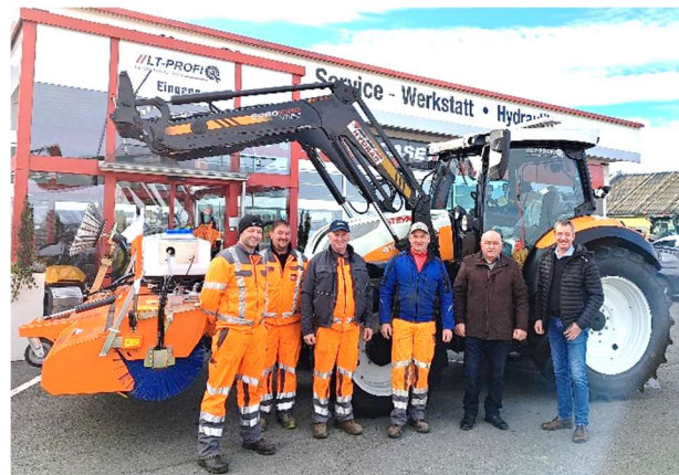
Vizebürgermeister Anton Milchrahm mit den Gemeindearbeitern bei der Fahrzeugübernahme

Ausgestattet wurde das Fahrzeug u. a. mit einem Frontlader, einem Arbeitskorb, einem Streugerät, einem Schneepflug sowie einer Kehrmaschine. Mit dieser Investition können die Arbeiten effizienter und wirtschaftlicher durchgeführt werden.